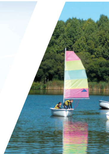
Base nautique de St-Quentin-en-Yvelines