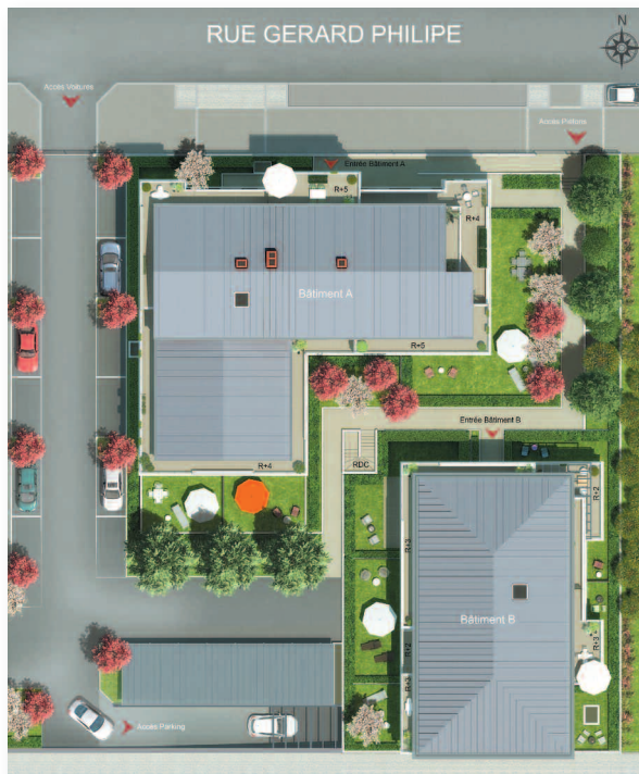
Plan de masse de la résidence New Rythmik

Avec le groupe ARCADE, offrez-vous la garantie d'un projet de vie qui répond à vos aspirations.