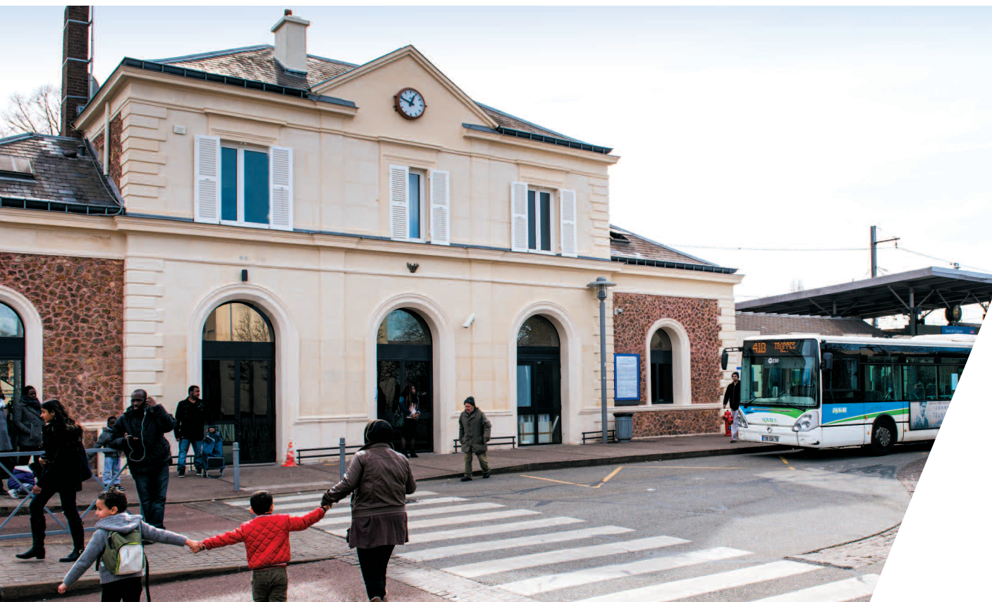
Gare de Trappes