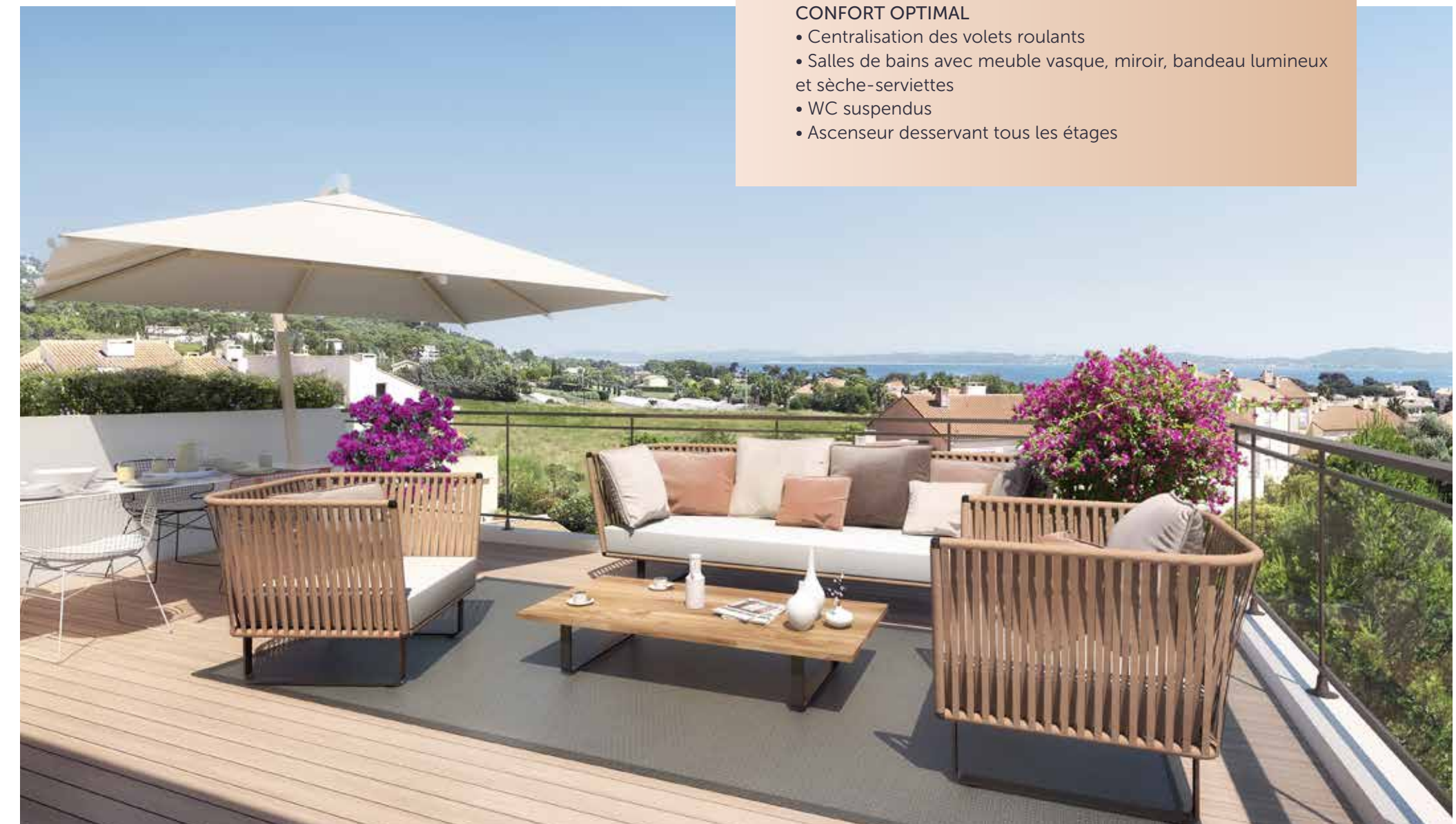
Appartement 3 pièces lot B33 de 82 m 2 avec une terrasse de 58 m 2 (revêtement façon parquet en option)