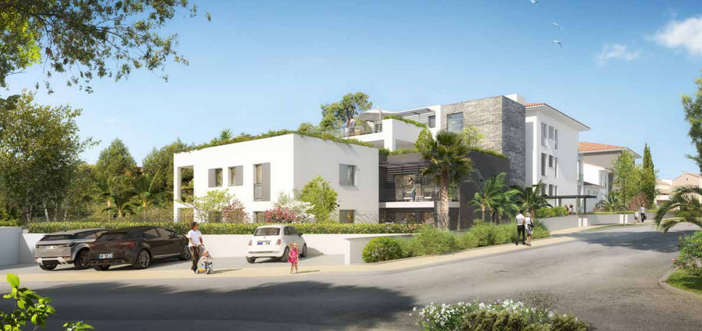
Vue de la résidence depuis l'Allée Saint-Vincent