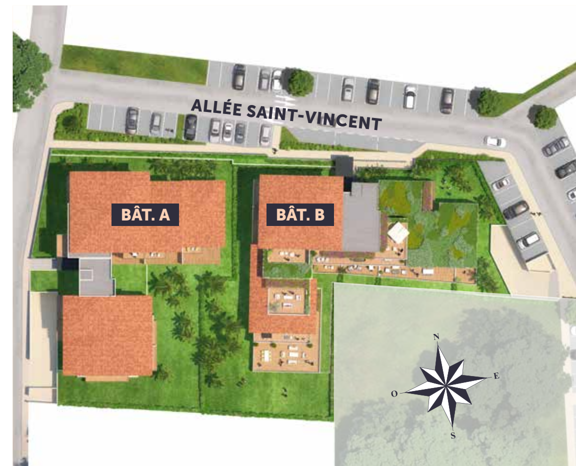
Plan de masse de la résidence