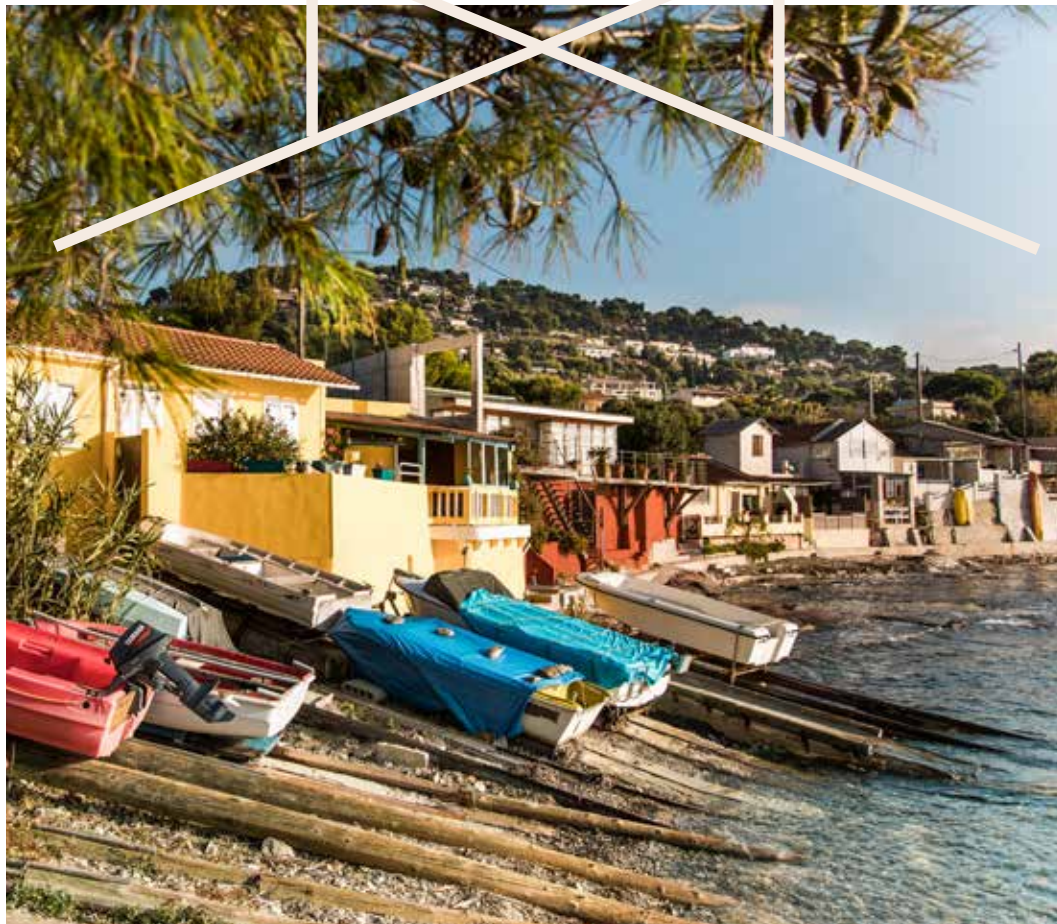
Le littoral du Cabro