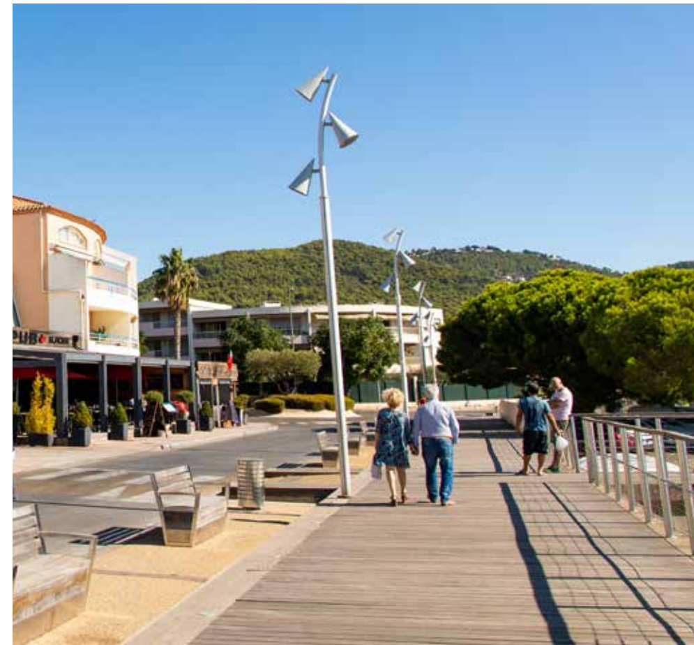
Les commerces et restaurants du port