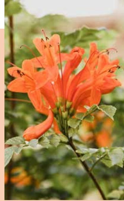
Un environnement fleuri