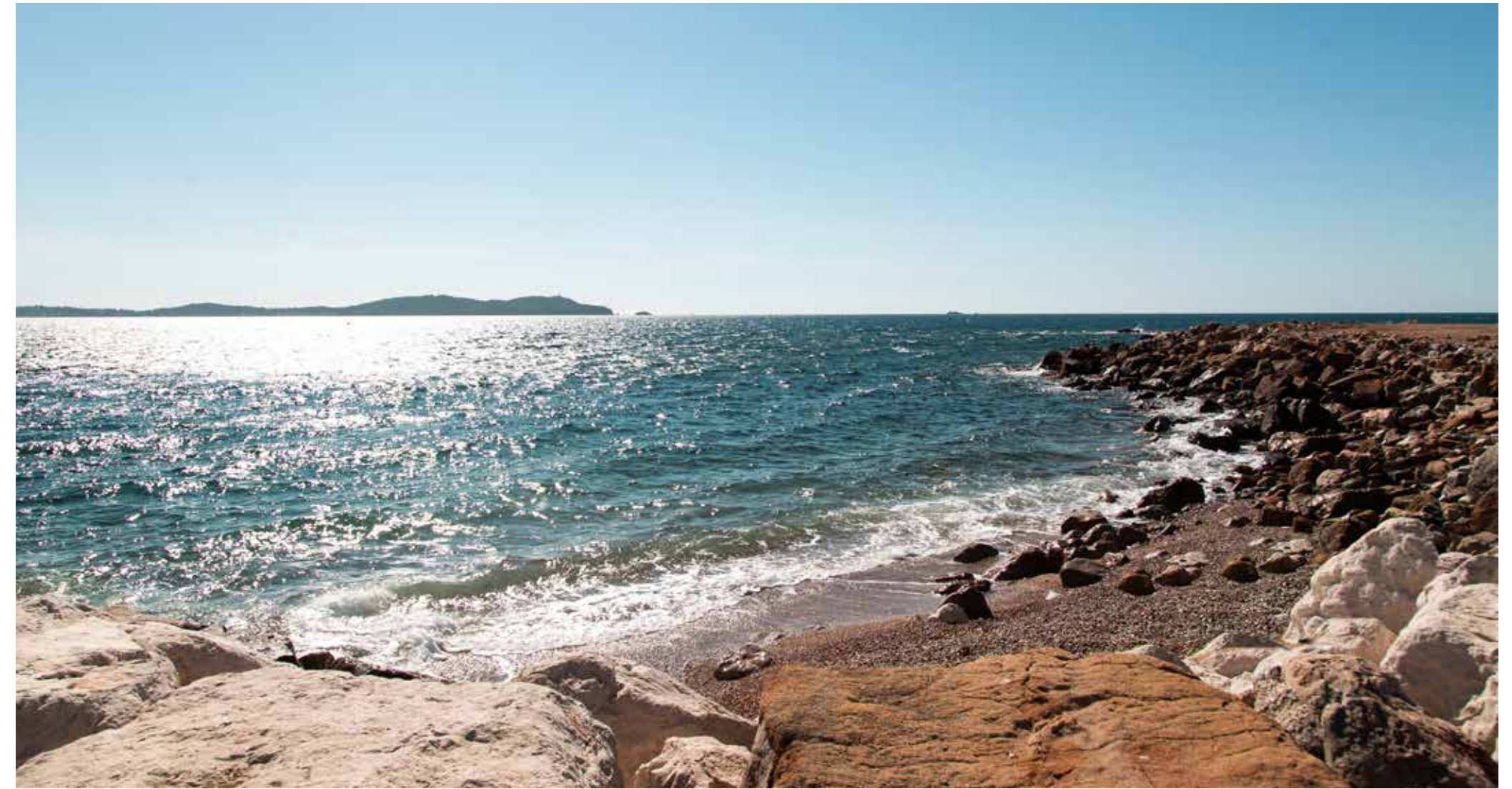
Les criques de Carqueiranne

Ici, le quotidien se partage entre randonnées nature, sports nautiques et rêveries sous les pins d'Alep à regarder les manœuvres des plaisanciers. C'est un bout de paradis duquel on s'échappe parfois, pour rejoindre le tout Var par l'A57. Le TGV ou l'avion nous emmènent encore plus loin, sans plus de distance à parcourir. C'est un endroit idéal pour qui veut prendre le temps de vivre.