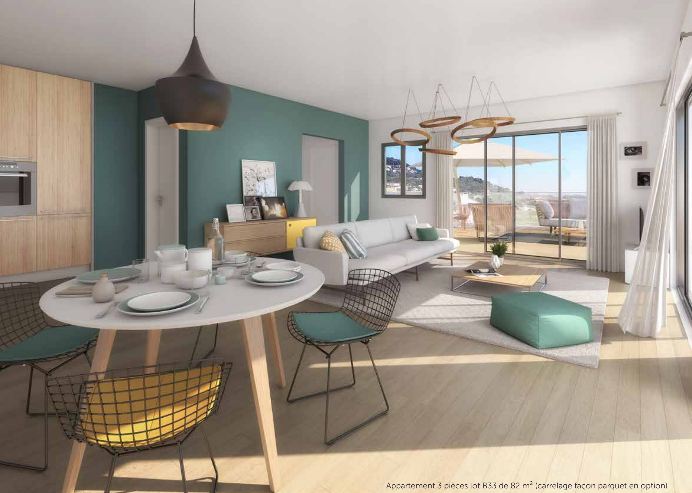
Appartement 3 pièces lot B33 de 82 m 2 (carrelage façon parquet en option)