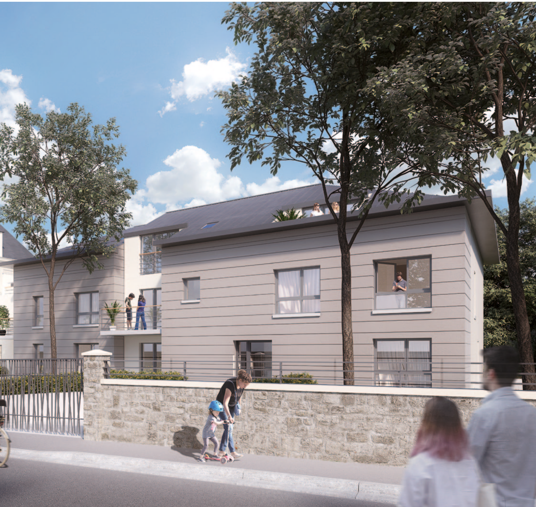
FAÇADE EST, RUE RENAUD À MONTMORENCY. ARCHITECTE : ÉRIC BOUCHARD