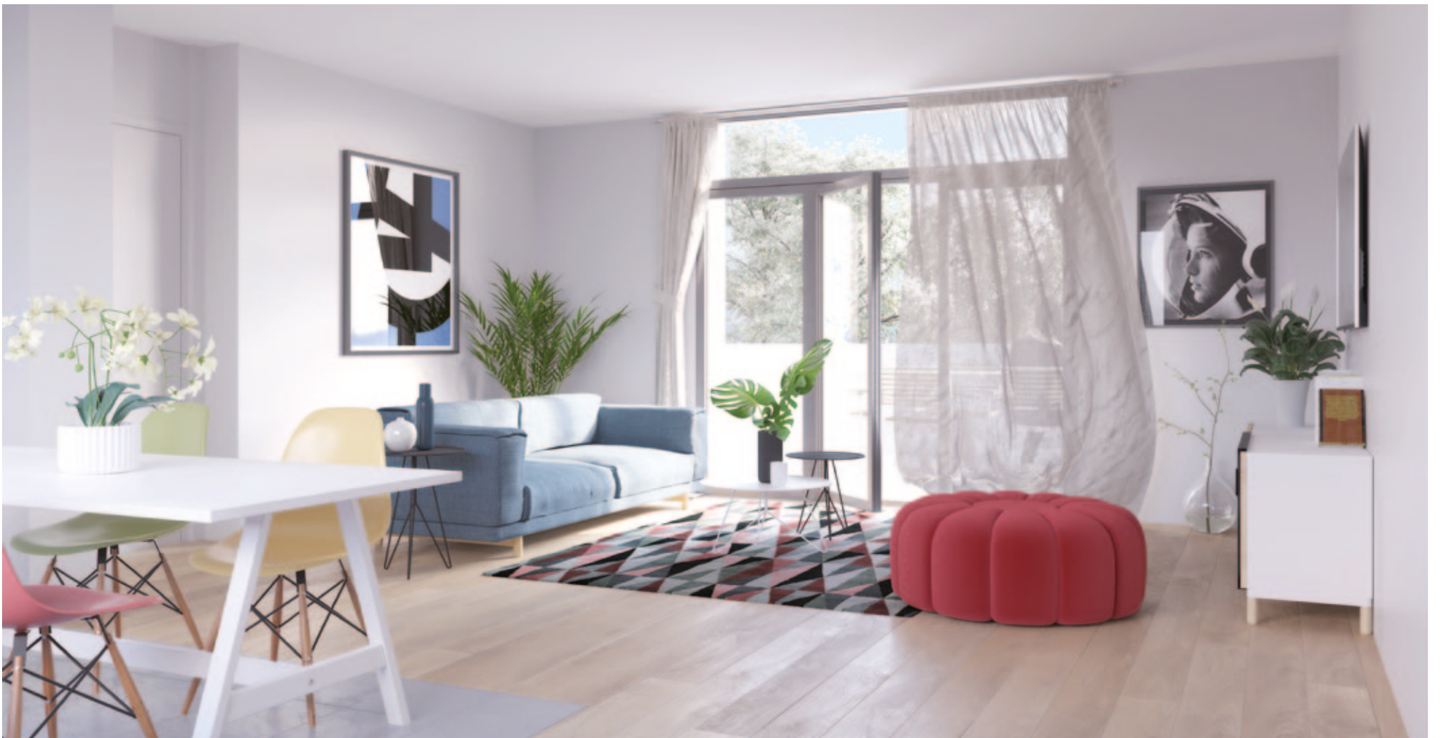
VUE INTÉRIEURE (LOT A008)