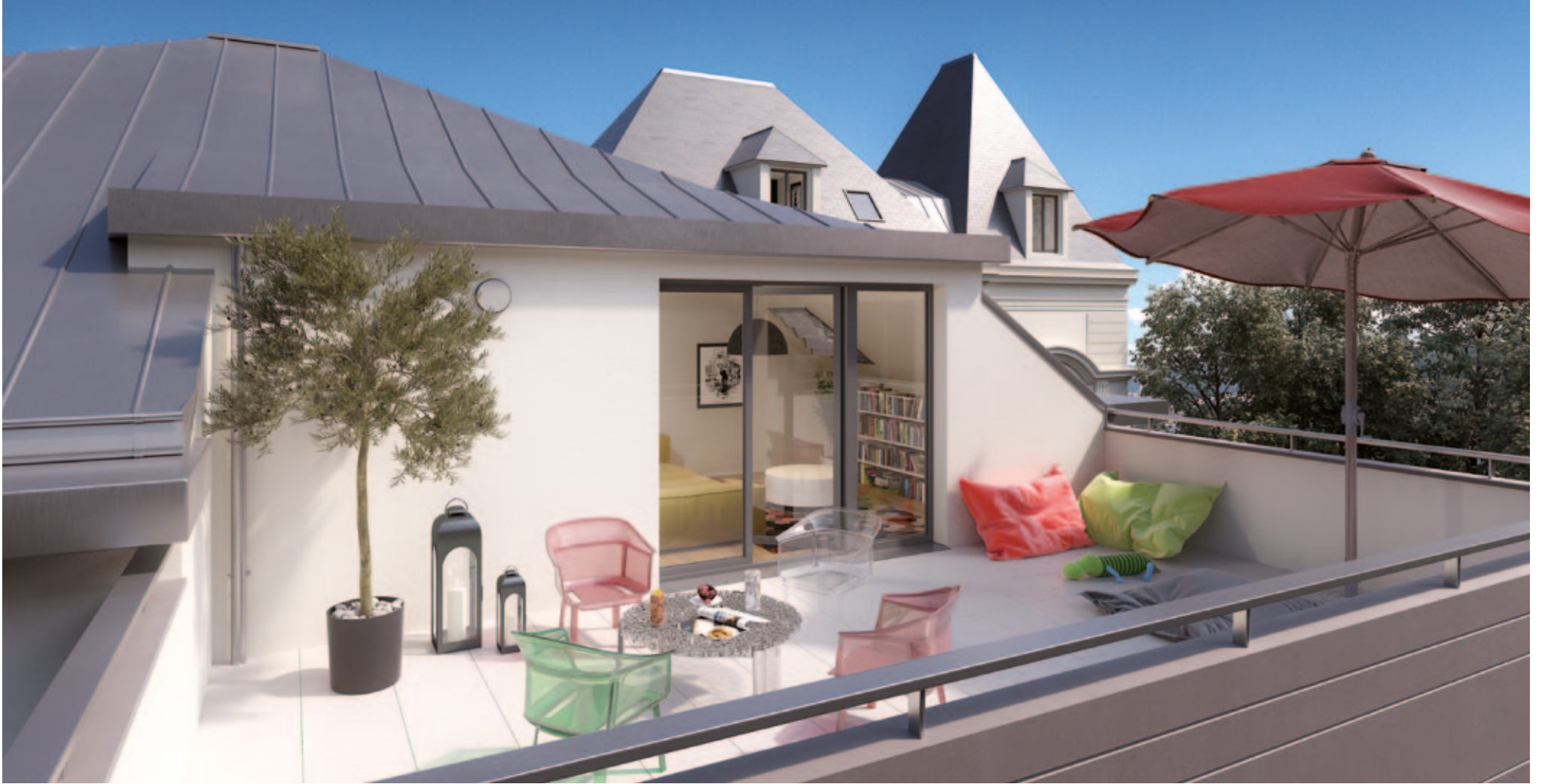
VUE EXTÉRIURE (LOT A202)