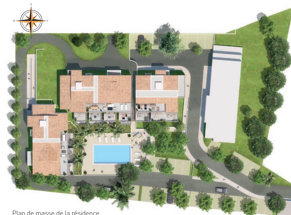
Plan de masse de la résidence