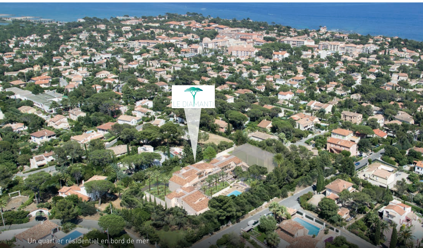
Un quartier résidentiel en bord de mer