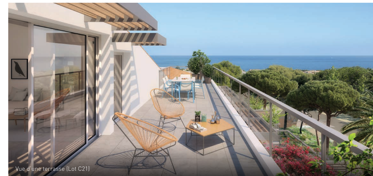
Vue d'une terrasse (Lot C21)