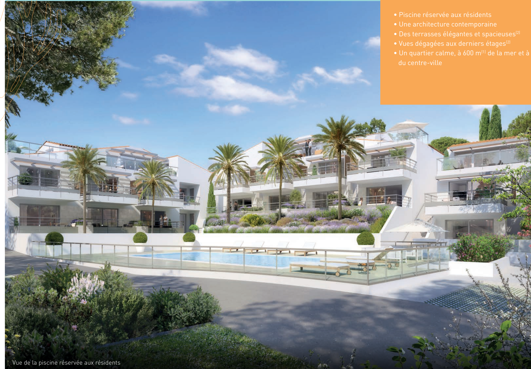
Vue de la piscine réservée aux résidents