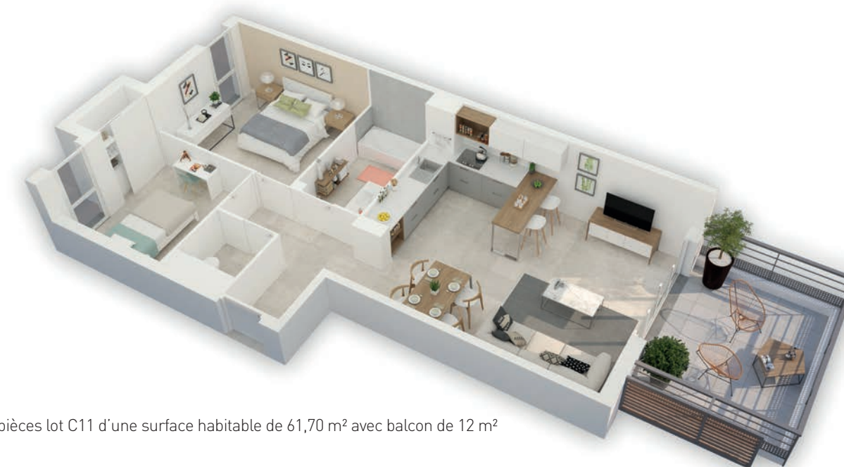
3 pièces lot C11 d'une surface habitable de 61,70 m 2 avec balcon de 12 m 2