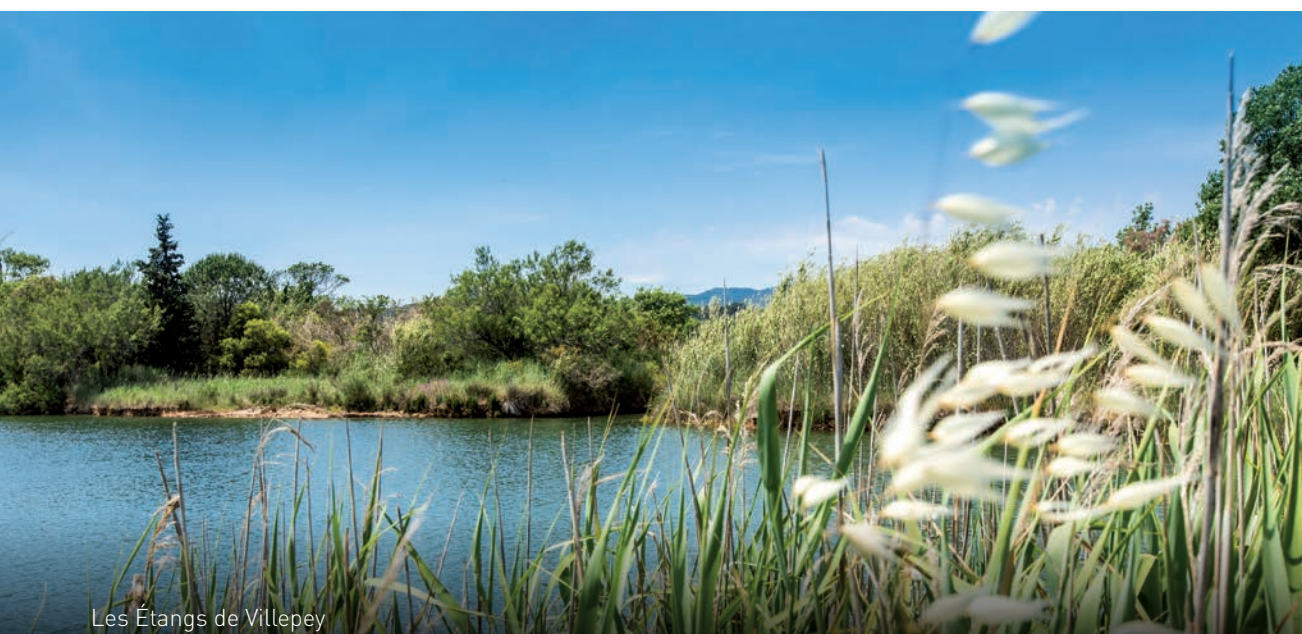
Les Étangs de Villepey