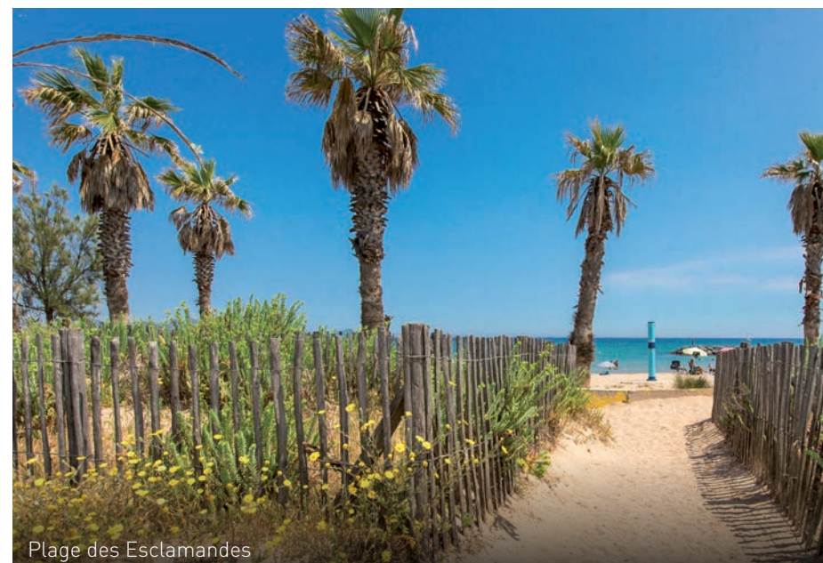
Plage des Esclamandes