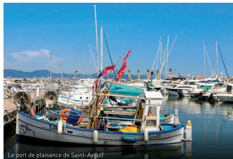
Le port de plaisance de Saint-Aygulf