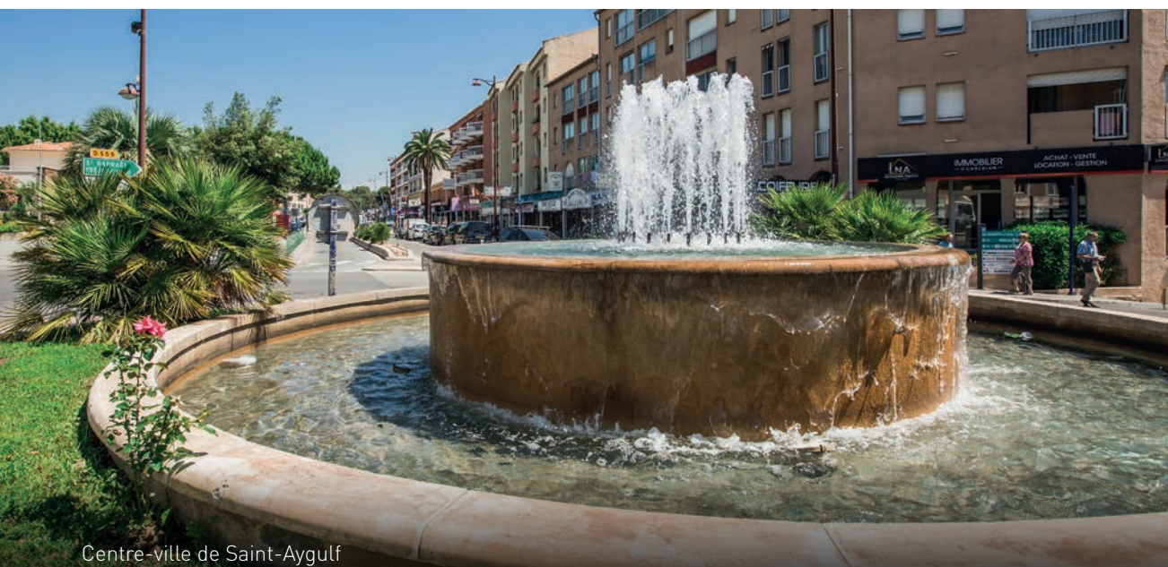
Centre-ville de Saint-Aygulf

Les commerces, la place du marché à 800 mètres (1) , les équipements culturels ou sportifs et les écoles maternelle et élémentaire sont proches, mais aussi les promenades sur le sentier du littoral ou la découverte des étangs de Villepey et de leur faune sauvage.