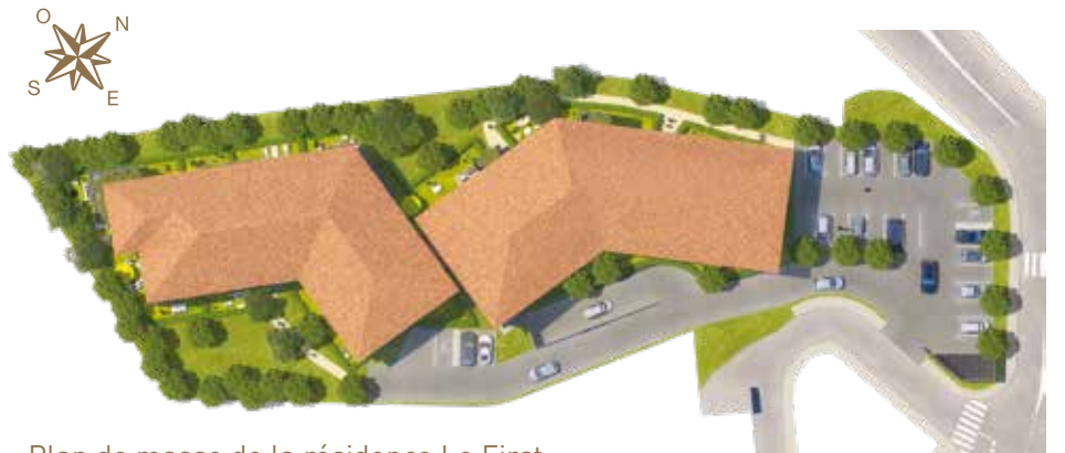
Plan de masse de la résidence Le First

Le First séduit au premier regard par son architecture résolument contemporaine et ses lignes fluides, rythmées par le jeu graphique des balcons et des terrasses. Surmontées d'un toit à quatre pentes très esthétique, les façades du bâtiment jouent sur les avancées et les retraits. Cette résidence intimiste de deux étages fait la part belle à la luminosité grâce aux larges baies vitrées. Les matériaux nobles, comme le verre et l'aluminium des garde-corps, composent un ensemble de qualité pérenne. Cet ensemble harmonieux est souligné par des éléments en béton structurés qui font écho aux murs habillés en pierre naturelle, conférant au bâtiment une identité unique. Une invitation au bien-être et à la douceur de vivre.