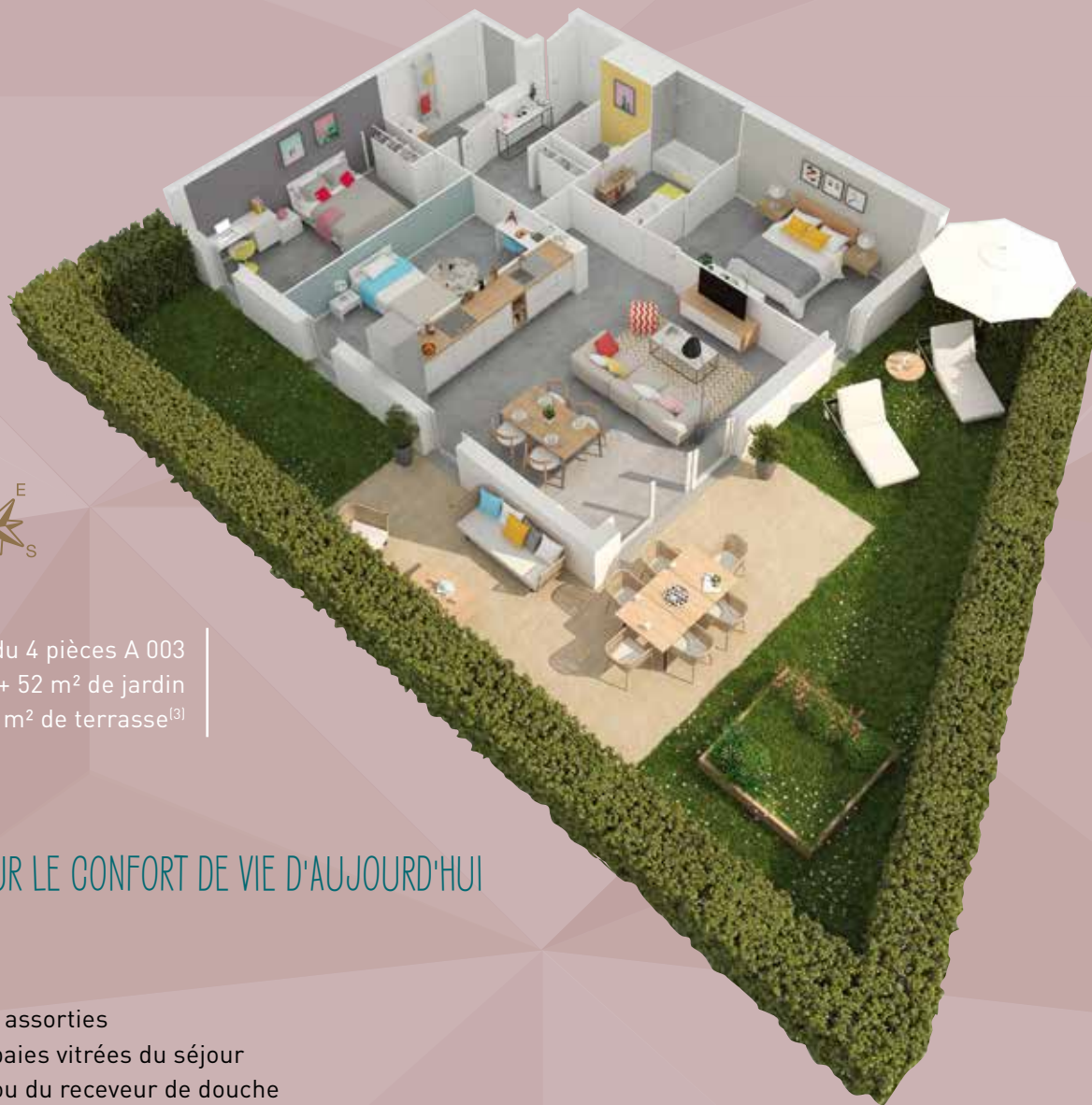
Illustration du 4 pièces A 003 79 m 2 + 52 m 2 de jardin + 26 m 2 de terrasse [3]

Pour encore plus de sérénité, la résidence est entièrement sécurisée grâce à un digicode à l'entrée du bâtiment ainsi qu'un vidéophone dans chaque appartement.