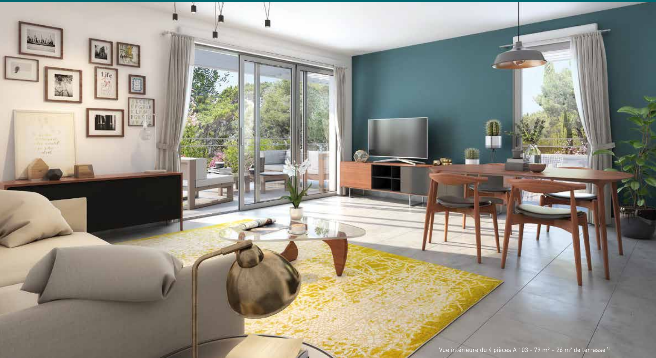
Vue intérieure du 4 pièces A 103 - 79 m 2 + 26 m 2 de terrasse (3)

ARCHE PROMOTION porte une attention particulière aux choix pérennes des matériaux et à la qualité de ses architectures. Les espaces intérieurs font l'objet de la même recherche de qualité et de satisfaction, tant par l'agencement des appartements que pour les prestations. Quant aux aménagements extérieurs et plus particulièrement les espaces verts, ils se composent d'essences végétales de la région, faciles à entretenir et peu gourmandes en eau, afin de réduire les coûts et veiller au respect de l'écosystème local.